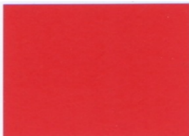
cherry red OP 3472008 (1 kg)