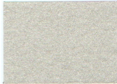
retroreflective 3472075 (1 kg)

Thinner base 3472084 (1 kg) catalyst FX 822 3470503 (100 g) 4 colour base thixo 3472058 (1 kg)