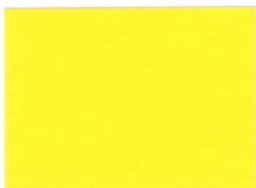
lemon OP 3472002 (1 kg)