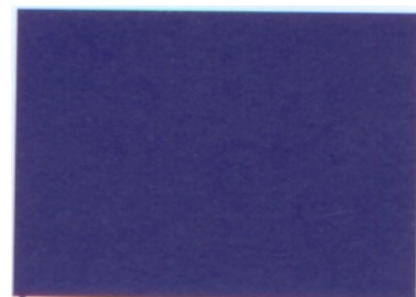
violet 3472042 (1 kg)