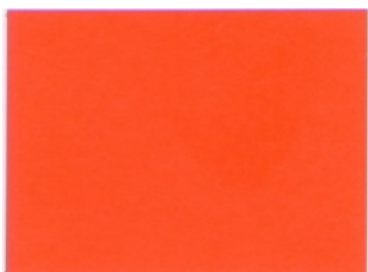
orange OP 3472006 (1 kg)