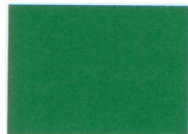
medium green OP 3472033 (1 kg)