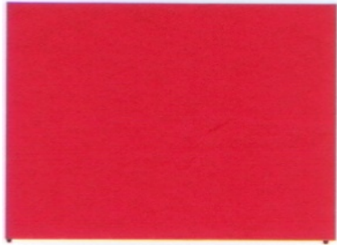
4-colour magenta thixo 3472052 (1 kg)