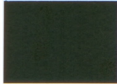
4-colour black thixo 3472056 (1 kg)

Thinner base 3472084 (1 kg) catalyst FX 822 3470503 (100 g) 4 colour base thixo 3472058 (1 kg)