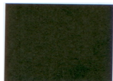
black 3472072 (1 kg)