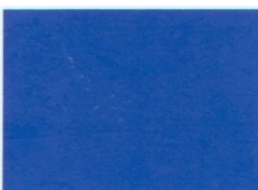
primary blue 3472048 (1 kg)