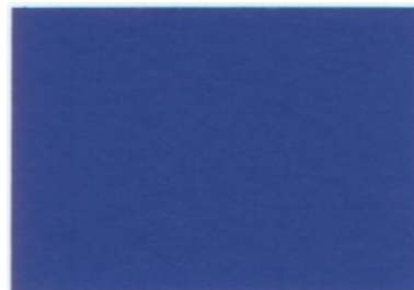
deep blue 3472050 (1 kg)