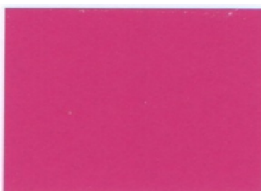
cyclamen 3472039 (1 kg)