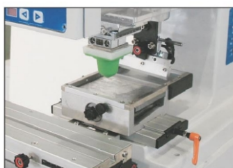
SYSTEM OTWARTY NANOSZENIA FARBY