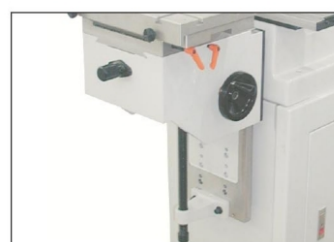
NOWY WZMOCNIONY STÓŁ KRZYŻOWY X-Y-Z