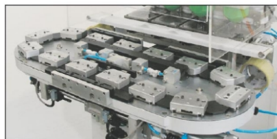
HVA-150/4 CMIC C16-4