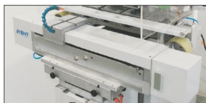
HVA-150/4 CMIC DR114