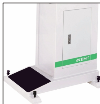
- Stojak pod maszynę (opcja)