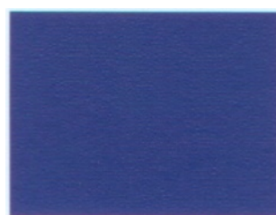
primary blue 3522020 (1 l)