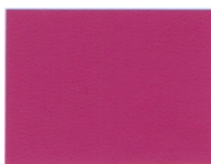
fuschia 3522015 (1 l)