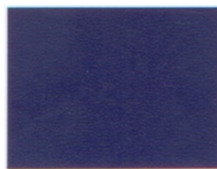
violet 3522016 (1 l)