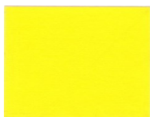
lemon 3522002 (1 l)

Przedstawione poniżej odcienie są poglądowe. Rzeczywiste odwzorowanie barw koncentratów pigmentów znajduje się we wzornikach kolorów Tiflex dostępnych w naszej firmie.