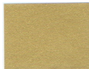
gold (1 l)