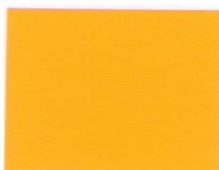
yellow 3522004 (1 l)