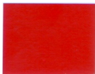
rubis red 3522011 (1 l)

thinner white 3544000 (5l) covering white 3544087 (5l) thinner base 3544066 (5l) hardener dedicated for curing under ambient temperature (temperatura pokojowa) retarder