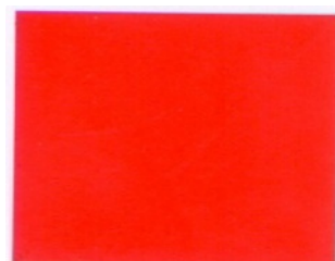
resist red 3522009 (1 l)