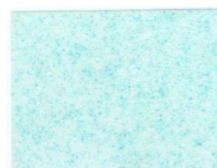
shiners (1 l)