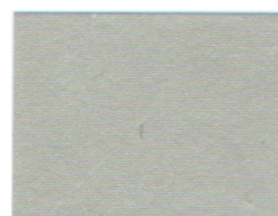
silver (1 l)