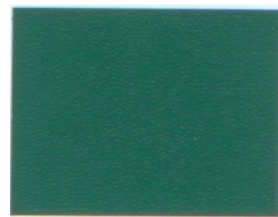
mint green 3522035 (1 l)