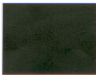
black 3522044 (1 l)